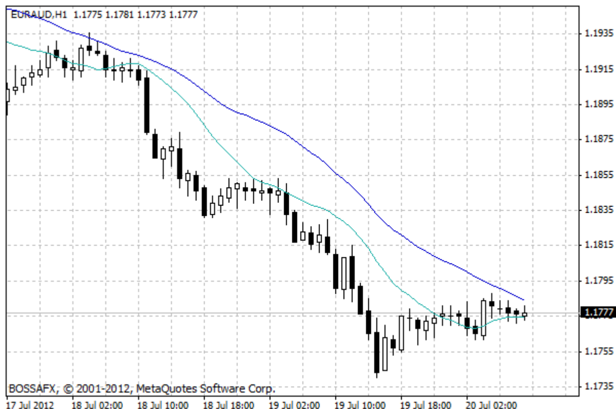
Wykres 2. Notowania EUR/AUD – dane godzinne.

W dłuższym terminie możliwy jest dalszy spadek notowań kursu EUR/AUD. Notowania tej pary walutowej systematycznie kierują się na południe od 18 maja br., kiedy to osiągnęły one lokalny szczyt tuż powyżej poziomu 1,30. Jednak długoterminowy trend wzrostowy trwa jednak już od jesieni 2008 r. – od tamtego czasu notowania EUR/AUD spadły o ponad 44% (z okolic 2,11 do obecnych 1,177-1,178).