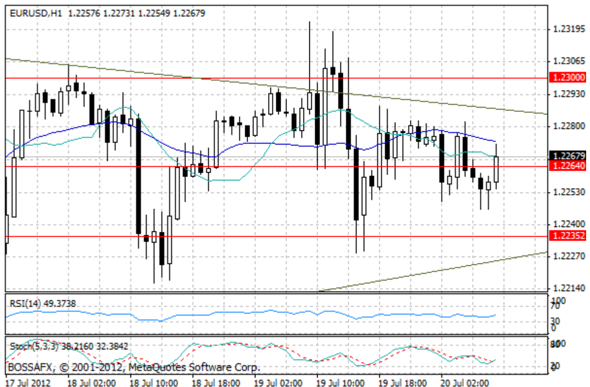
Wykres 1. Notowania EUR/USD – dane godzinne.

Wczorajsze wyjście kursu EUR/USD ponad poziom 1,23 okazało się jedynie krótkim epizodem. Obawy dotyczące kłopotów zadłużeniowych w strefie euro znów bowiem o sobie przypomniały, spychając notowania eurodolara wczesnym popołudniem do rejonu 1,2229. Wprawdzie później notowania nieco odbiły w górę, jednak nadal utrzymują się one w formacji klina, a najbliższymi technicznymi barierami są linie średnich ruchomych.