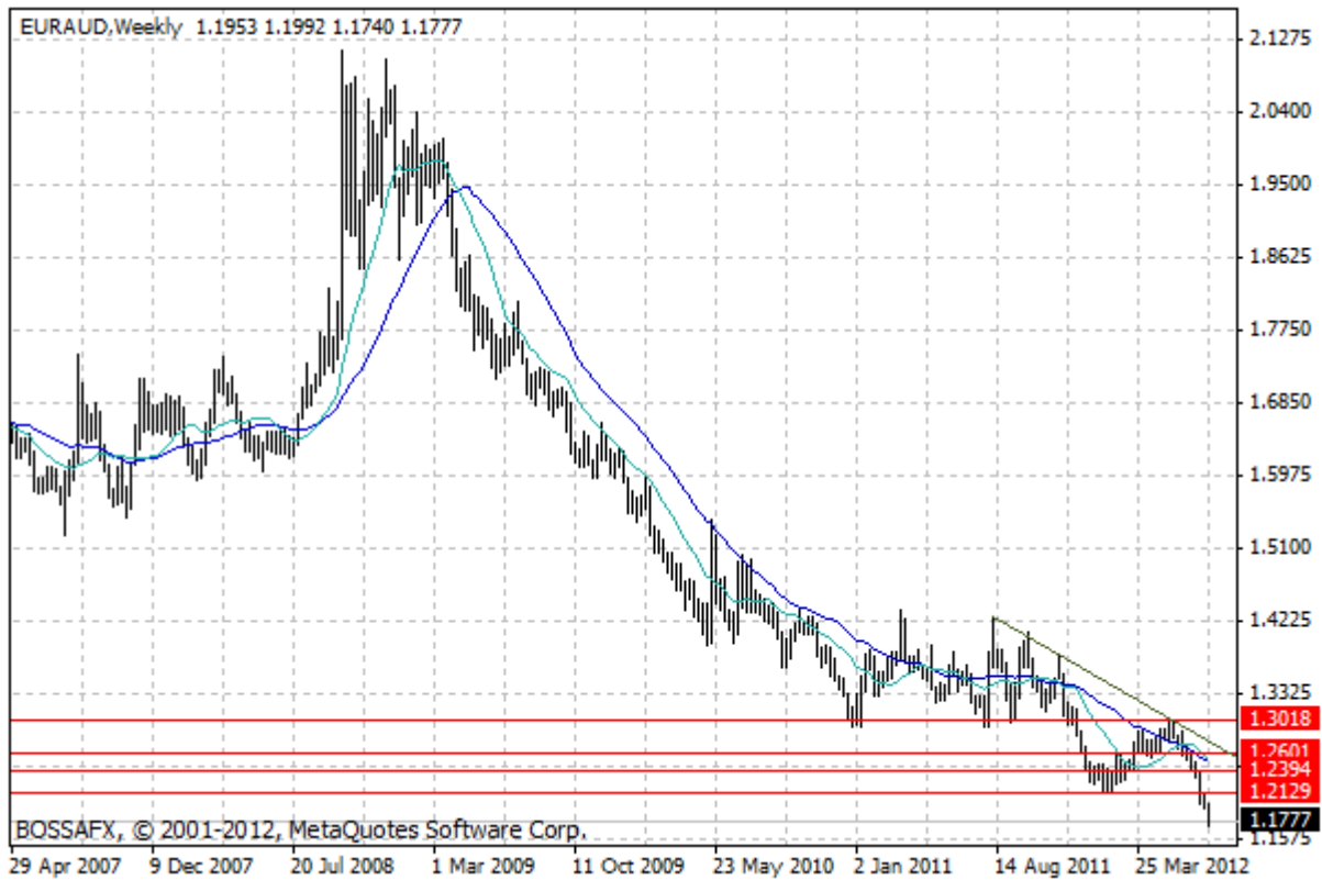
Wykres 3. Notowania EUR/AUD – dane tygodniowe.