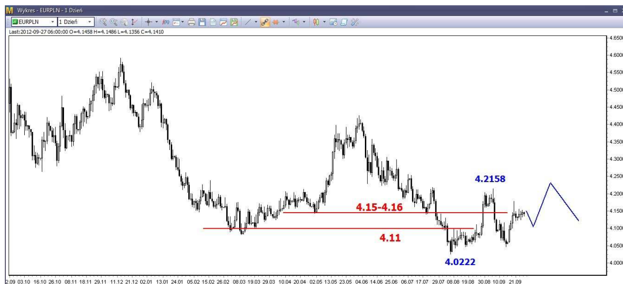
Wykres 4. Euro w relacji do złotego (EUR/PLN)

Tydzień temu w czwartek zaczęła się lokalna korekta. Po jej zakończeniu oczekują powrotu w rejon szczytu z sierpnia w rejonie 4.2158 PLN (wykres 4). W dalszej kilkumiesięcznej perspektywie oczekują spadków i powrotu na tegoroczne minimum (4.02 PLN) i niżej.