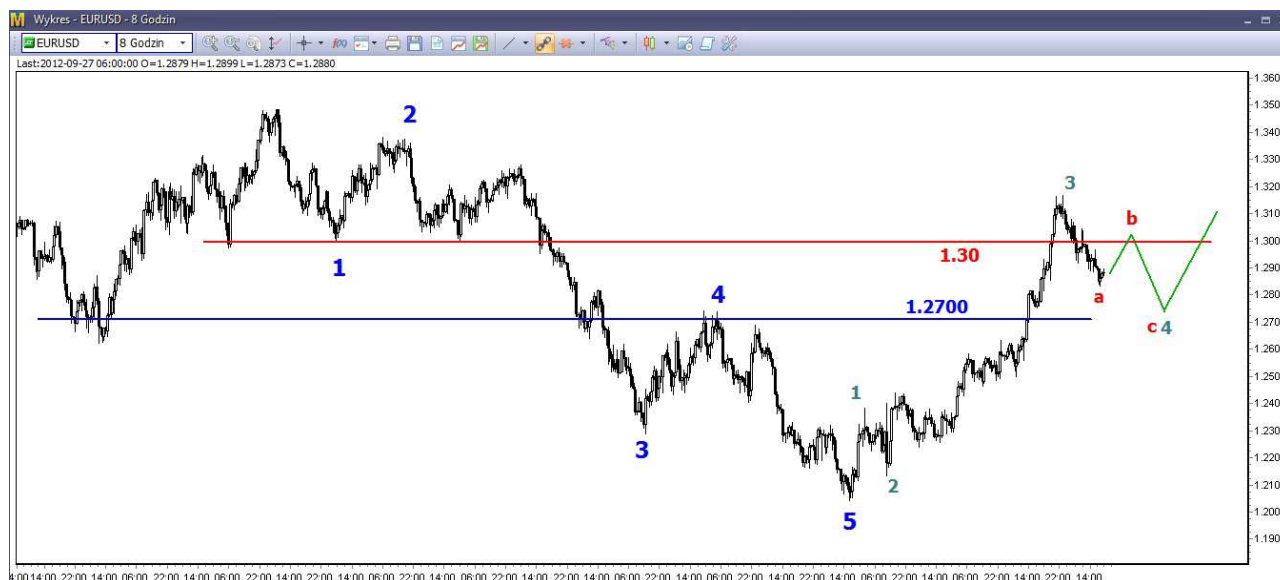
Wykres 2. Eurodolar w perspektywie średnioterminowej

USD/PLN – W środę złoty tracił. Kurs dolara osiągnął dzienne maksimum na poziomie 3.2350 PLN (poprzednio 3.2207 PLN). Po godzinie 17-tej doszło do spadków. Zamknięcie wypadło po 3.2156 PLN. Dziś rano o godzinie 09:40 dolar był notowany po 3.2155 PLN (poprzednio 3.2180 PLN).