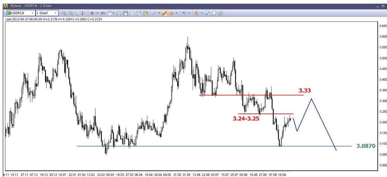
Wykres 3. Dolar amerykański w relacji do złotego (USD/PLN)

Próba rozbicia z marszu silnego oporu w rejonie 3.24-3.25 PLN nie powinna się udać. W efekcie możliwe jest korekcyjne cofnięcie do wsparcia w rejonie 3.1620-3.1680 PLN. W dalszej perspektywie możliwy