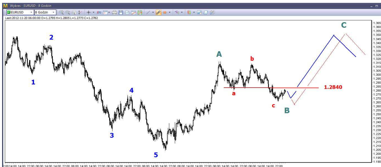
Wykres 2. Eurodolar w perspektywie średnioterminowej

USD/PLN – W poniedziałek kurs dolara spadał do dziennego dna na poziomie 3.2141 PLN, po godzinie 22-giej doszło do odbicia. Zamknięcie wypadło po 3.2232 PLN. Dziś rano o godzinie 09:00 dolar był notowany po 3.2360 PLN (poprzednio 3.2473 PLN).