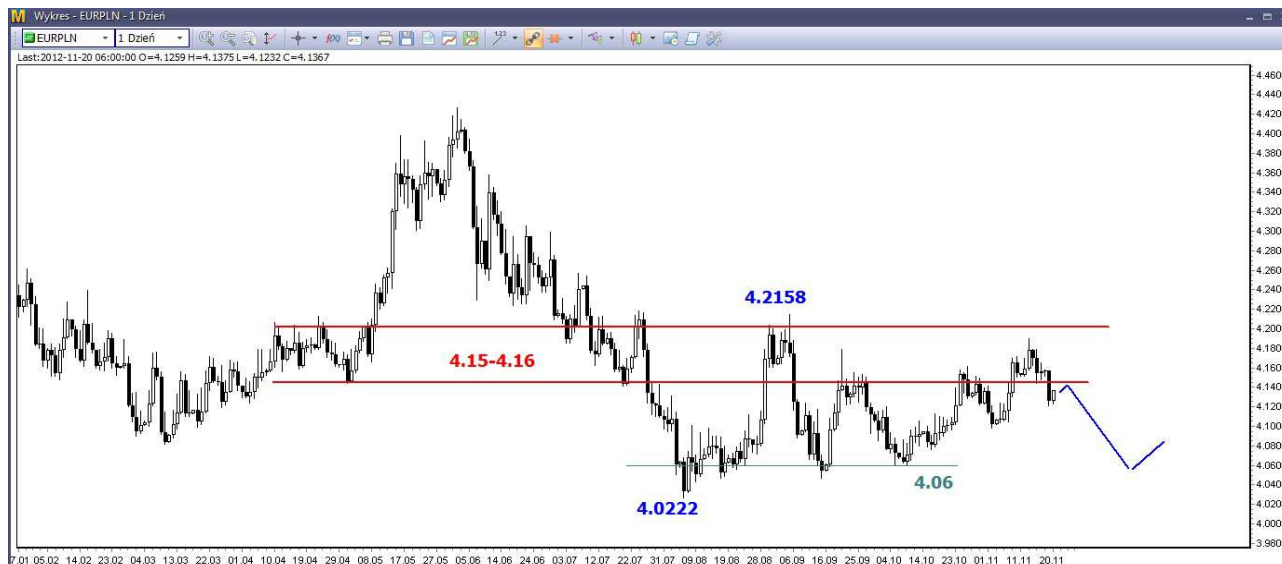
Wykres 4. Euro w relacji do złotego (EUR/PLN)

Wczoraj doszło do przekroczenia ważnego wsparcia w rejonie 4.15-4.16 PLN, może to oznaczać możliwość powrotu na wrześniowe dno (4.06 PLN) a w dalszej perspektywie jeszcze niżej. W perspektywie krótkoterminowej możliwe jest niewielkie odbicie (wykres 4), w dalszej perspektywie spadki.