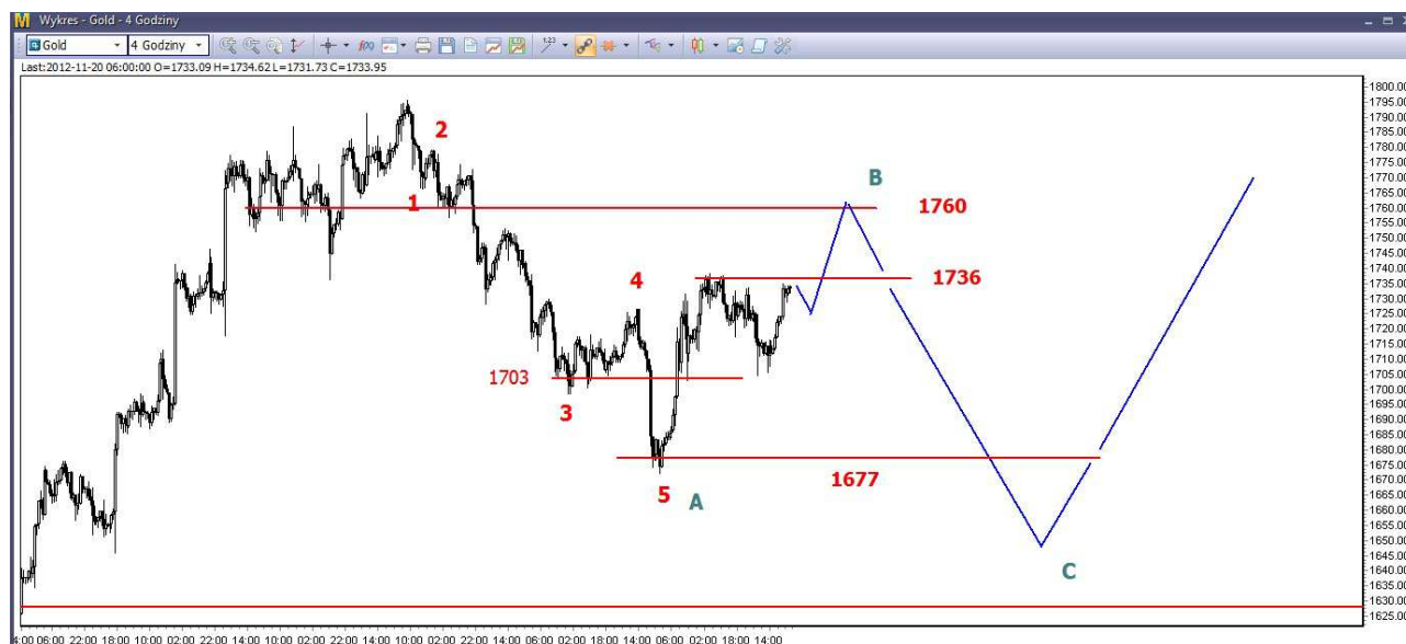
Wykres 5. Kontrakty CFD na złoto

Kontrakty CFD na złoto - Od 2 tygodni trwa odbicie. W dniu 9-go listopada osiągnięte zostało lokalne maksimum na poziomie 1738.55 USD. Potem doszło do lokalnej korekty (wykres 5). Dziś rano o godzinie 09:30 kontrakty były notowane po 1733.8 USD.