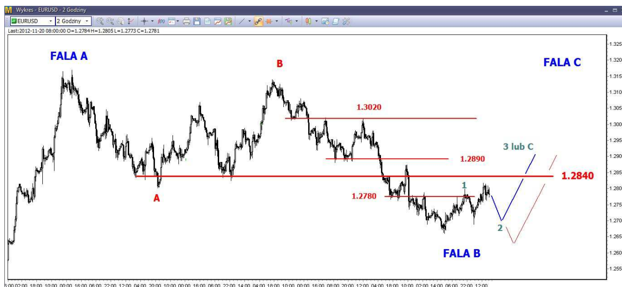
Wykres 1. Eurodolar w perspektywie krótkoterminowej

Krótki termin: Do utrzymania obecnej tendencji wzrostowej konieczna jest obrona wsparcia w rejonie 1.2785 USD. Z drugiej strony byki muszą respektować silny i kluczowy opór w rejonie 1.2840 USD. Próba rozbicia tego oporu w trakcie obecnej fali wzrostowej jest obciążona dużym ryzykiem. Nie można wykluczyć sytuacji, że poprawa nastrojów to pułapka i w perspektywie krótkoterminowej możliwy byłby jeszcze mocny ruch na południe w rejon piątkowego dna i dopiero później doszłoby do dalszych wzrostów i trwałego przełamania średnioterminowego oporu 1.2840 USD (niebieska linia, wykres 1). Scenariusz alternatywny zakłada, że podaży uda się zepchnąć kurs euro na ostatnie minimum (1.2660 USD), jednak próba jego trwałego rozbicia się nie uda i w efekcie dojdzie do budowy trwalszego trendu wzrostowego, którego celem będzie atak na wrześniowy szczyt (czerwona linia, wykres 1).