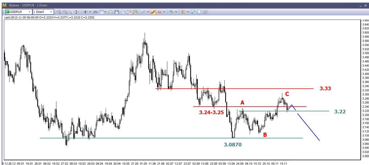
Wykres 3. Dolar amerykański w relacji do złotego (USD/PLN)

W mojej ocenie tydzień temu mogło dojść do przesilenia. Sprawdzianem tej tezy powinno być przełamanie przez eurodolar oporu w rejonie 1.2840 USD a to powinno doprowadzić do pojawienia się kolejnej fali umocnienia złotego (wykres 3). Kurs dolara mógłby wrócić na tegoroczne minimum. Sygnał pojawi się po przełamaniu wsparcia w rejonie szczytu fali (A) na poziomie 3.22 PLN.