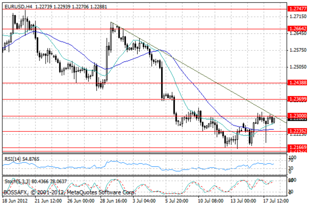
Wykres 2. Notowania EUR/USD – dane 4-godzinne.