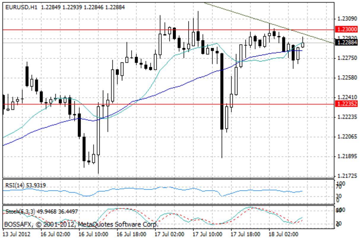
Wykres 1. Notowania EUR/USD – dane godzinne.