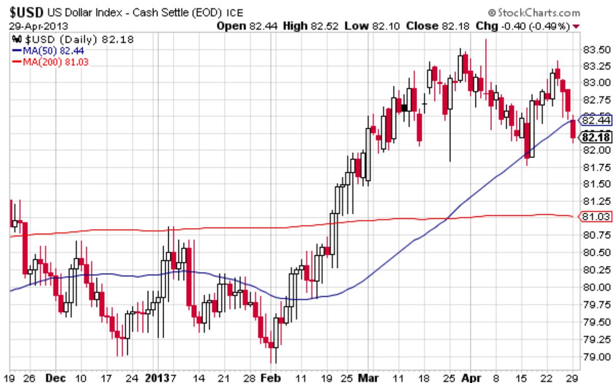
Wykres 1. Notowania US Dollar Index – dane dzienne.

Amerykański dolar rozpoczął bieżący tydzień wyraźnym osłabieniem względem wielu głównych światowych walut. Zostało to odzwierciedlone na indeksie dolara – wczoraj US Dollar Index zanotował spadek o niemal pół procenta, kończąc sesję na poziomie 82,18 pkt. Jest to najniższa wartość indeksu od niemal dwóch tygodni.