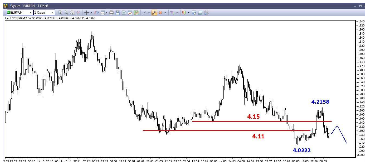
Wykres 4. Euro w relacji do złotego (EUR/PLN)

W krótkim terminie możliwe jest odbicie. Krótkoterminowy opór znajduje się w rejonie 4.09 PLN, po jego pokonaniu pojawi się sygnał do kilkusecyjnej fali wzrostów (musi to być potwierdzone przez spadki na eurodolarze). Opór w rejonie 4.15-4.16 PLN powinien być poza zasięgiem popytu. W dalszej perspektywie oczekuję spadków i powrotu na tegoroczne minimum (4.02 PLN) i niżej (wykres 4).