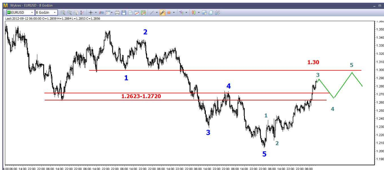
Wykres 2. Eurodolar w perspektywie średnioterminowej

USD/PLN – Wczoraj doszło do ustanowienia kolejnego dna na poziomie 3.1619 PLN, zamknięcie po 3.1662 PLN. Dziś rano o godzinie 09:15 dolar był notowany po 3.1675 PLN (poprzednio 3.2070 PLN).