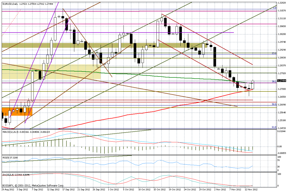
Wykres dzienny EUR/USD

ruch ponad kluczowy opór na 1,2747, tylko potwierdza, iż znajdujemy się w istotnym punkcie zwrotnym. Niemniej dopiero wyraźniejszym potwierdzeniem tego scenariusza będzie ruch w stronę 1,2830-40, poziomów „przedwyborczych”, a także wyznaczanych przez linię potencjalnego kanału spadkowego. Jeżeli uznać wskazania płynące z tygodniowego wykresu koszyka BOSSA USD za trafne, należałoby oczekiwać, iż w perspektywie do końca roku kurs EUR/USD wróci wyraźnie ponad poziom 1,30.