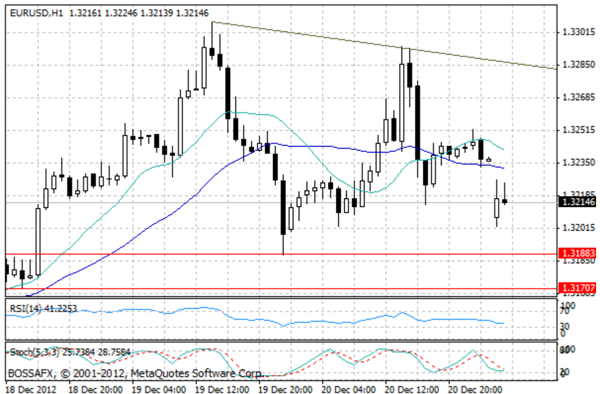
Wykres 1. Notowania EUR/USD – dane godzinne.