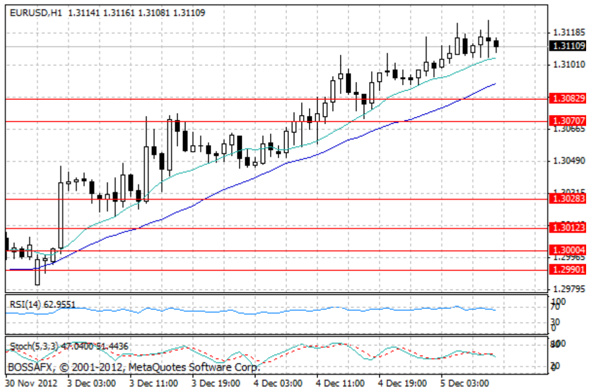
Wykres 1. Notowania EUR/USD – dane godzinne.