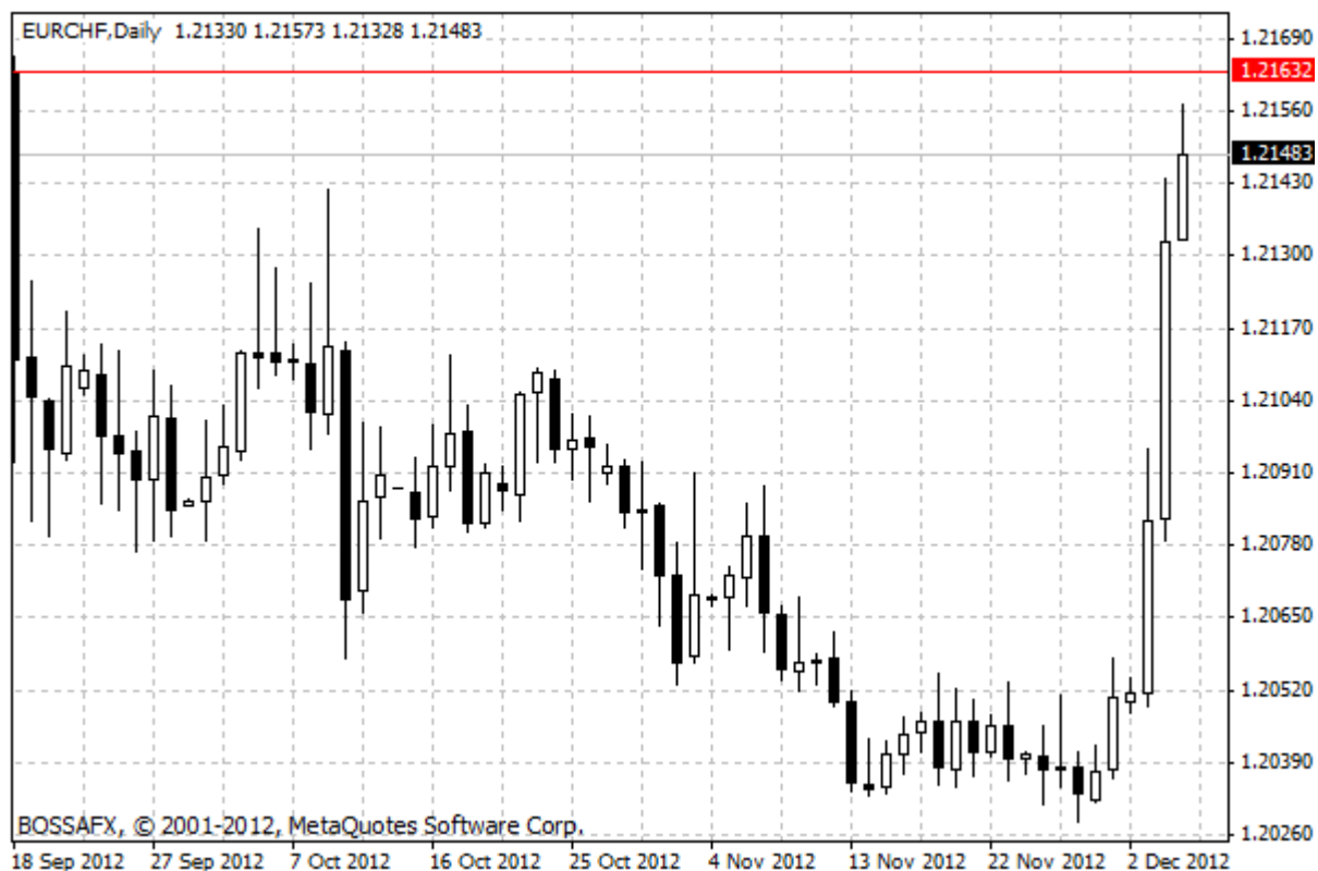
Wykres 3. Notowania EUR/CHF – dane dzienne.