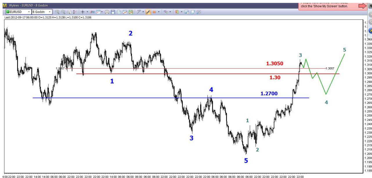
Wykres 2. Eurodolar w perspektywie średnioterminowej

USD/PLN – W piątek doszło do ustanowienia kolejnego dna na poziomie 3.0859 PLN (poprzednio 3.1182 PLN), zamknięcie po 3.0867 PLN. Dziś rano doszło do dalszych spadków. O godzinie 09:45 dolar był notowany po 3.1130 PLN (poprzednio 3.1095 PLN).