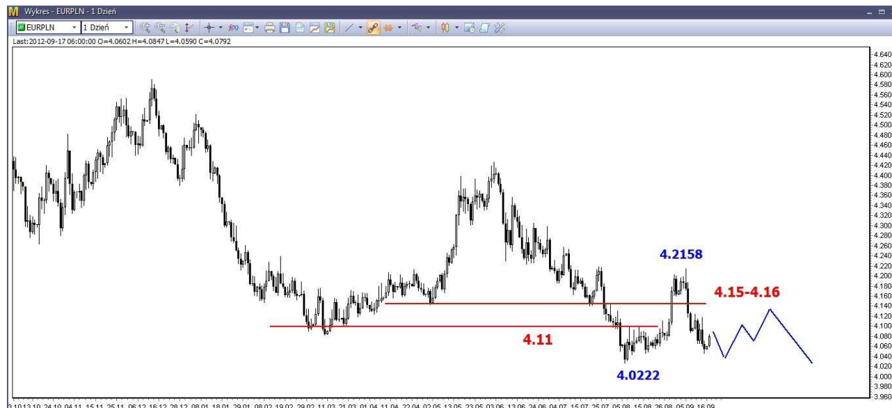
Wykres 4. Euro w relacji do złotego (EUR/PLN)

W krótkim terminie możliwe jest korekcyjne odbicie, potem dalsze spadki. Wsparcie w rejonie 4.0222 PLN nie powinno zostać zaatakowane. W dalszej perspektywie oczekuję mocniejszego odbicia (wtedy gdy na eurodolarze dojdzie do realizacji zysków). Opór znajduje się w rejonie 4.15-4.16 PLN i powinien powstrzymać odbicie (wykres 4). W dalszej perspektywie oczekuję spadków i powrotu na tegoroczne minimum (4.02 PLN) i niżej.