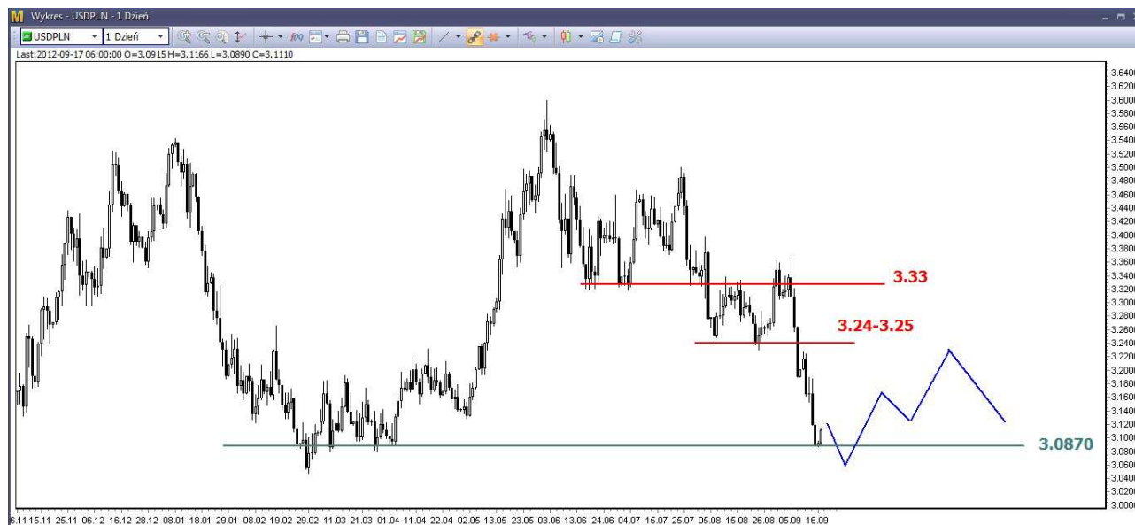
Wykres 3. Dolar amerykański w relacji do złotego (USD/PLN)

W krótkim terminie może dojść do niewielkiej lokalnej korekty. Potem oczekuję kolejnego dna. Wsparcie znajduje się w rejonie 3.0500-3.0870 PLN. Potem możliwe dłuższe i silniejsze odbicie, nawet pod opór w rejonie 3.24-3.25 PLN (wykres 3). W dalszej perspektywie oczekuję kolejnej fali spadków w rejon 3.00 PLN i niżej.