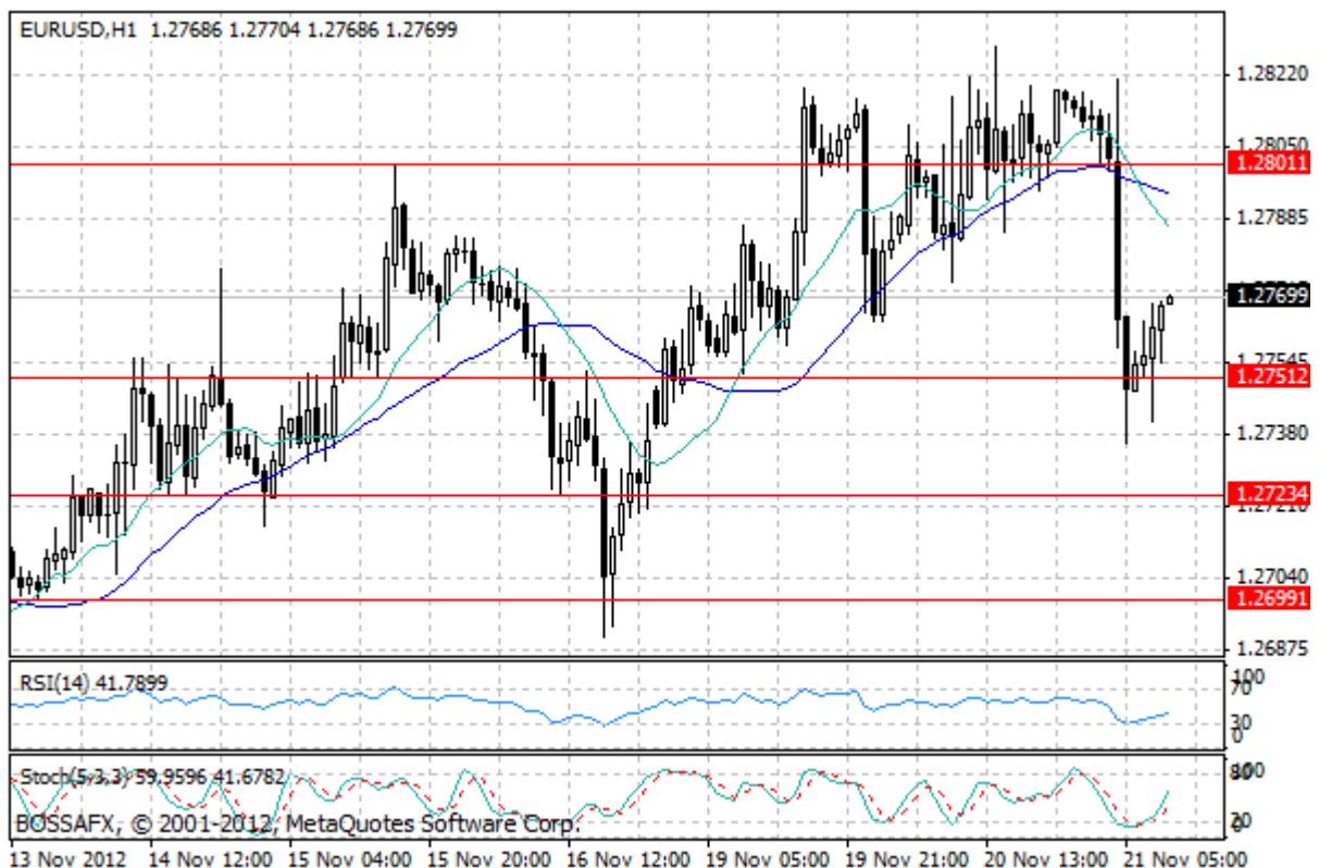
Wykres 1. Notowania EUR/USD – dane godzinne.

Brak porozumienia Eurogrupy w sprawie pomocy dla Grecji był dla inwestorów dużym rozczarowaniem, pomimo że nikt raczej nie wątpił w to, że decyzja w tej kwestii nie będzie łatwa. Tak czy inaczej, 12-godzinna debata ministrów finansów zakończyła się bez istotnych rozstrzygnięć, co mocno zaszkodziło wartości wspólnej europejskiej waluty. Kurs eurodolara, który jeszcze wczoraj po południu przymierzał się do sforsowania poziomu 1,2830, dzisiaj nad ranem zapikował, schodząc chwilowo nawet poniżej 1,2740. Ostatecznie jednak, wsparcie w rejonie 1,2750 okazało się skuteczne i obecnie kurs EUR/USD oscyluje tuż powyżej poziomu 1,2760.