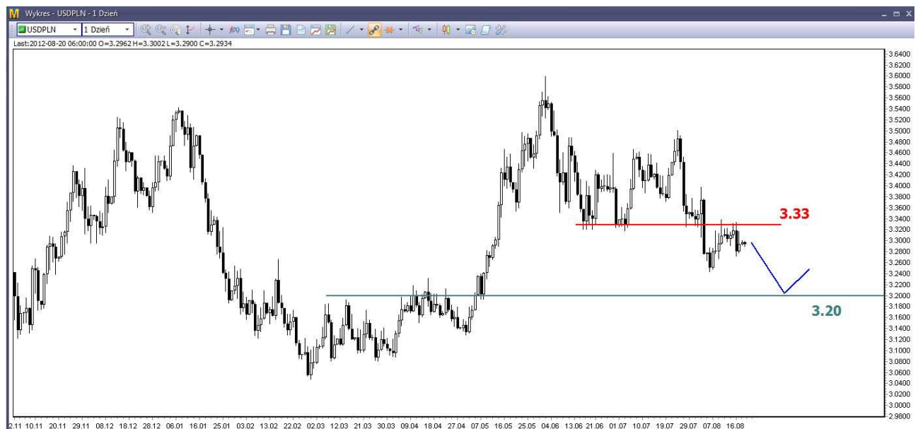
Wykres 3. Dolar amerykański w relacji do złotego (USD/PLN)

Odbicie z sierpniowego dna (3.2395 PLN) ma dosyć duże rozmiary, ale nie jest w stanie pokonać silnej bariery w okolicy 3.33 PLN (wykres 3). Poprawa sytuacji na eurodolarze (strona 1) powinna doprowadzić do umocnienia złotego (spadek kursu dolara). Wsparcie dla dolara znajduje się w rejonie 3.19-3.20 PLN.