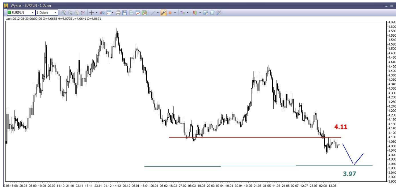
Wykres 4. Euro w relacji do złotego (EUR/PLN)

Odbicie z sierpniowego dna (4.0222 PLN) utknęło pod silnym oporem w rejonie 4.11 PLN (wykres 4). W perspektywie najbliższych dni oczekują spadków. Wsparcie znajduje się w rejonie 3.97-4.00 PLN.