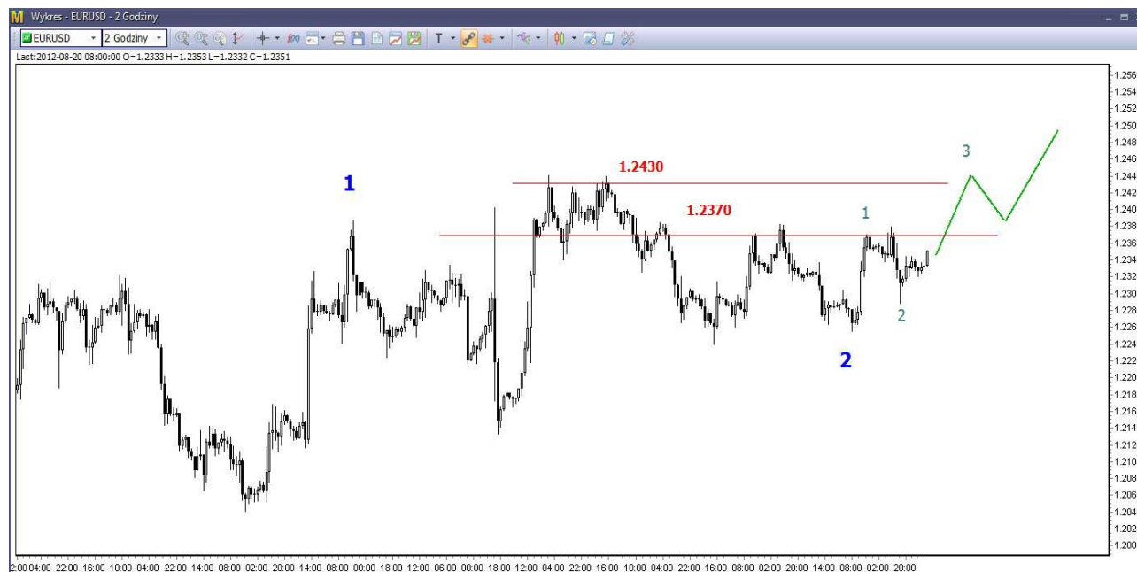
Wykres 1. Eurodolar w perspektywie krótkoterminowej

Pokonanie oporu w rejonie 1.2430-1.2442 USD będzie oznaczać, że jesteśmy w trakcie korekty spadków z tegorocznego szczytu (1.35 USD). Taka korekta może potrwać kilka tygodni i doprowadzić do wzrostów nawet w rejon 1.26 USD. Tam znajduje się kluczowy opór w postaci styczniowego dna (1.2623 USD).