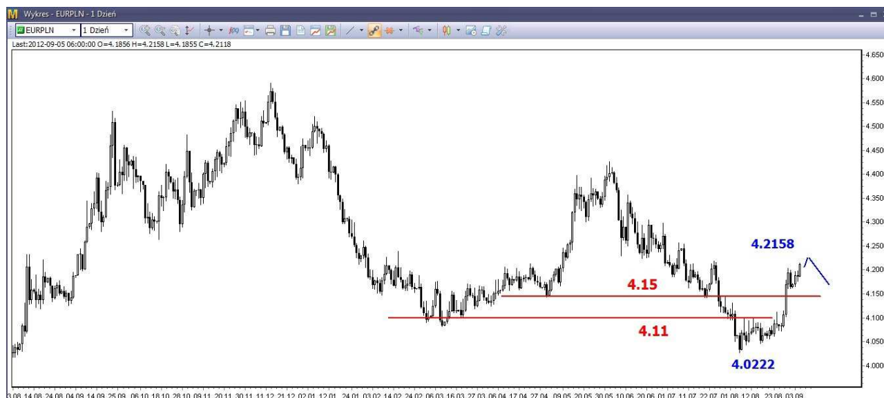
Wykres 4. Euro w relacji do złotego (EUR/PLN)

W krótkim terminie możliwe są wzrosty. Podobnie jak na parze USD/PLN nie powinny być one silne. Potem oczekuję zwrotu na południe. Wsparcie znajduje się w rejonie 4.15-4.16 PLN (wykres 4).