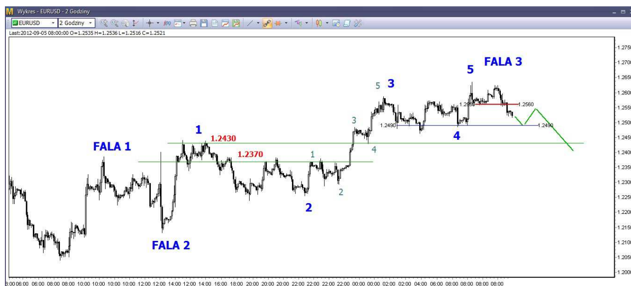
Wykres 1. Eurodolar w perspektywie krótkoterminowej

Krótki i średni termin: Spadki z wczorajszego szczytu są dosyć duże. W krótkim terminie możliwe jest zejście w rejon wsparcia wyznaczonego przez minima z ostatnich kilkunastu dni. Znajdują się one w obszarze 1.2465-1.2500 USD. Potem możliwe jest odbicie. Ważny krótkoterminowy opór znajduje się w okolicy 1.2560-1.2570 USD jeśli nie dojdzie do jego przełamania to możliwe są dalsze spadki (wykres 1). W przeciwnym wypadku możliwy powrót na ostatnie szczyty. Jest to mniej prawdopodobny scenariusz, aczkolwiek w czwartek podczas wystąpienia szefa ECB mogą się różne rzeczy zdarzyć.