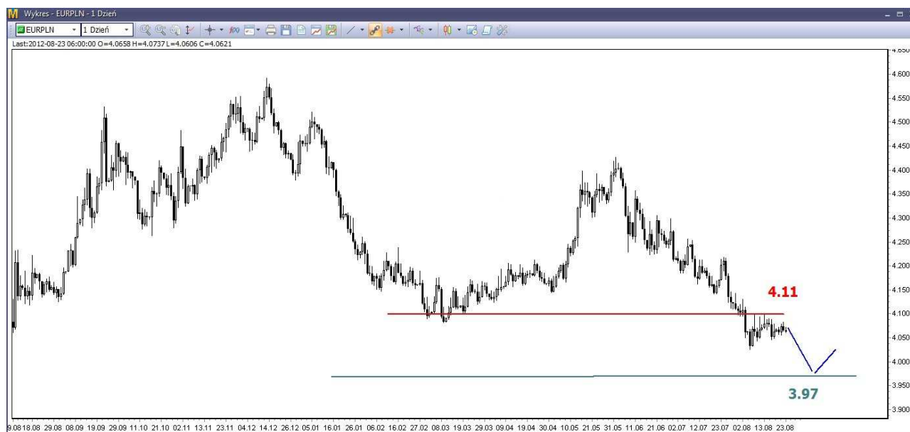
Wykres 4. Euro w relacji do złotego (EUR/PLN)

Odbicie z sierpniowego dna (4.0222 PLN) utknęło pod silnym oporem w rejonie 4.11 PLN (wykres 4). W perspektywie najbliższych dni oczekuję spadków. Wsparcie znajduje się w rejonie 3.97-4.00 PLN.