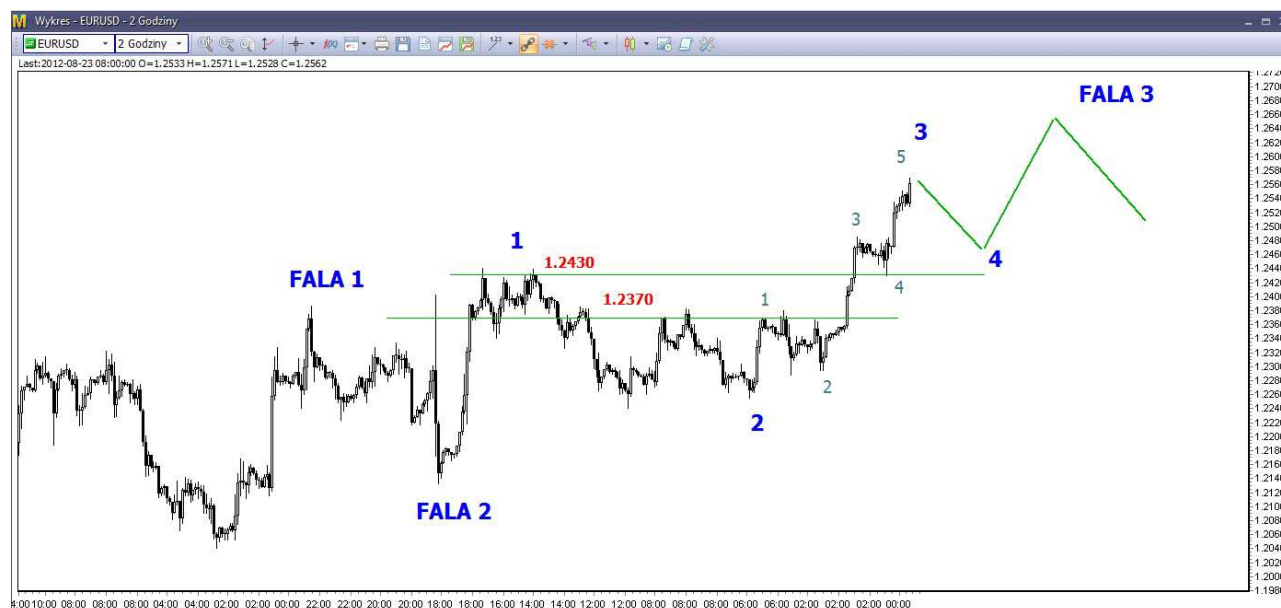
Wykres 1. Eurodolar w perspektywie krótkoterminowej

W mojej ocenie znajdujemy się w trakcie korekty spadków z tegorocznego szczytu (1.35 USD). Taka korekta może potrwać kilka tygodni (co już jest faktem) i może doprowadzić do wzrostów w rejon 1.26 USD (co też