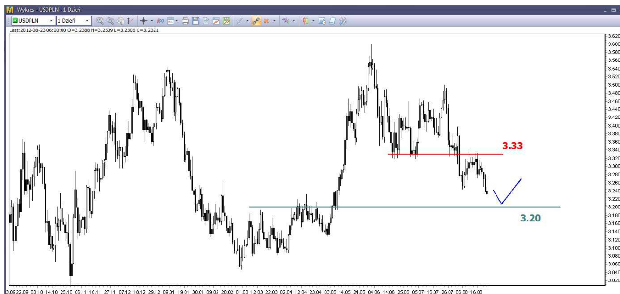
Wykres 3. Dolar amerykański w relacji do złotego (USD/PLN)

USD/PLN – W środę doszło do spadków. Dzielne minimum wypadło na poziomie 3.2457 PLN. Zamknięcie po 3.2460 PLN. Dziś doszło do dalszych spadków. O godzinie 09:20 dolar był notowany po 3.2320 PLN (poprzednio 3.2665 PLN).