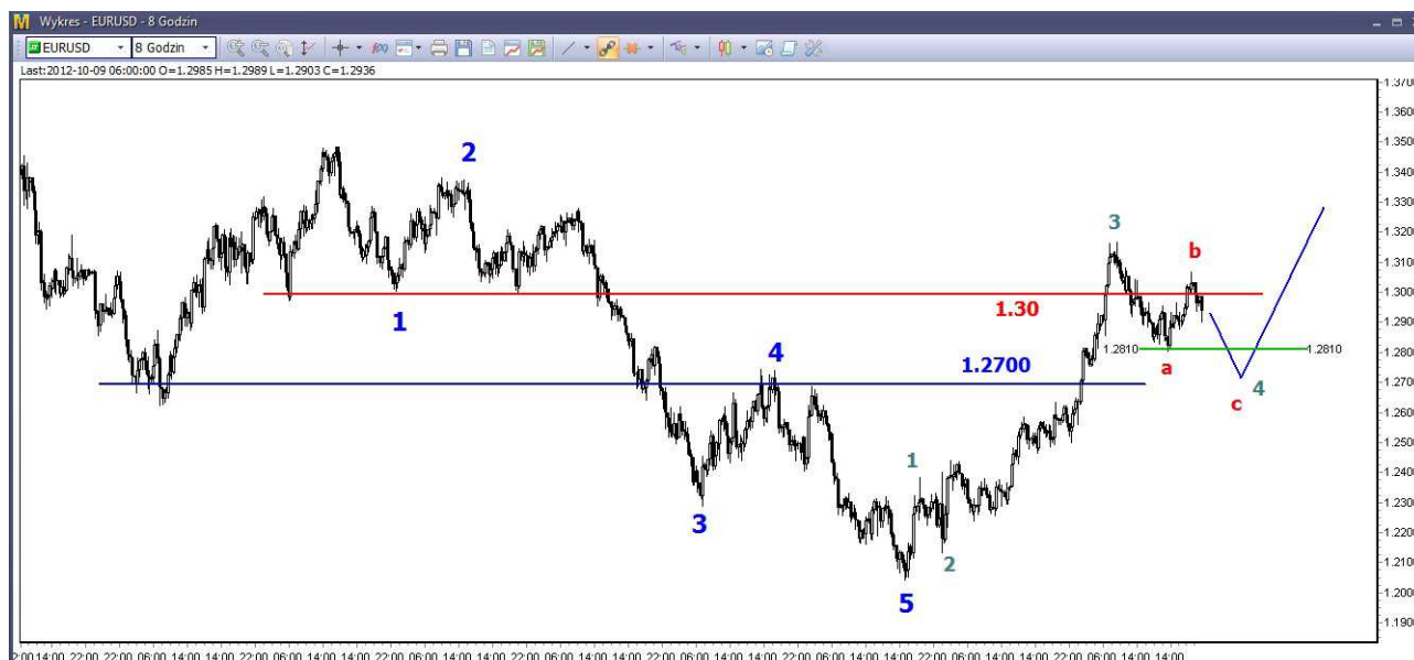
Wykres 2. Eurodolar w perspektywie średnioterminowej

USD/PLN – W poniedziałek kurs dolara wzrósł do poziomu 3.1582 PLN, po południu doszło do silnego cofnięcia do 3.1309 PLN. Zamknięcie po 3.1315 PLN. Dziś rano o godzinie 11:30 dolar był notowany po 3.1475 PLN (poprzednio 3.1445 PLN).