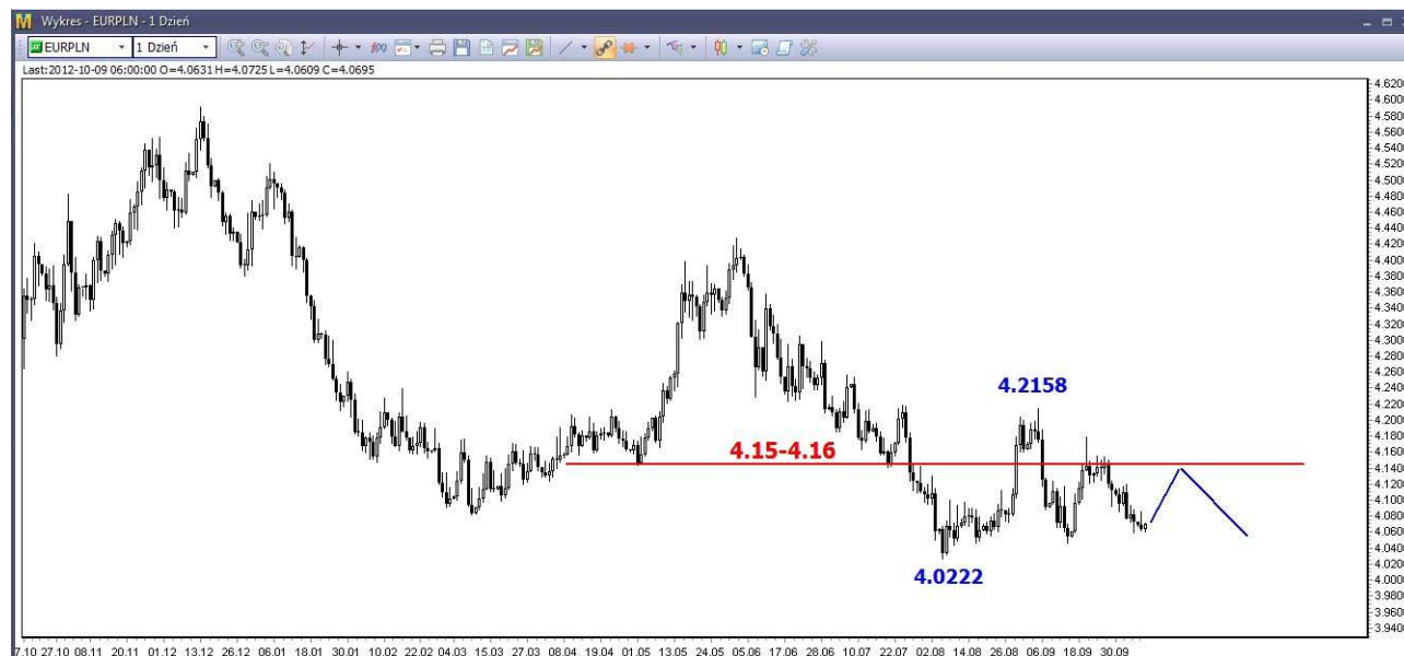
Wykres 4. Euro w relacji do złotego (EUR/PLN)

Wczorajsza reakcja na mocniejsze spadki eurodolara była niewielka. Pod koniec dnia kurs euro spadł do nowego lokalnego dna. W perspektywie najbliższych dni oczekuję na mocniejszy ruch w górę. Opór w rejonie 4.15-4.16 PLN a być może i 4.11 PLN może być poza zasięgiem popytu (wykres 4). W kilkumiesięcznej perspektywie możliwe spadki i powrót na tegoroczne minimum (4.02 PLN) i niżej.