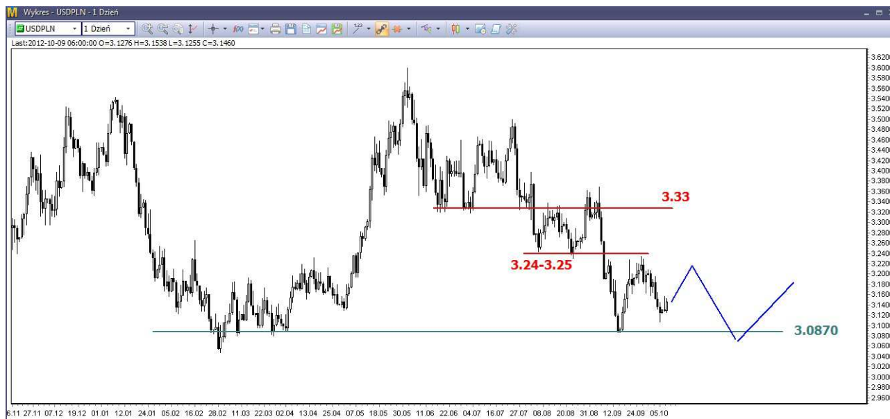
Wykres 3. Dolar amerykański w relacji do złotego (USD/PLN)

Wczorajsze odbicie zostało po południu spacyfikowane. Kurs dolara w relacji do złotego zachowuje się słabiej niż do euro. Dalsze spadki na eurodolarze (umocnienie dolara) powinny się również przełożyć na wzrost kursu dolara do złotego. Silny opór w rejonie 3.24-3.25 PLN nie powinien być zagrożony. W dalszej perspektywie oczekuję powrotu na wrześniowe minimum (wykres 3).