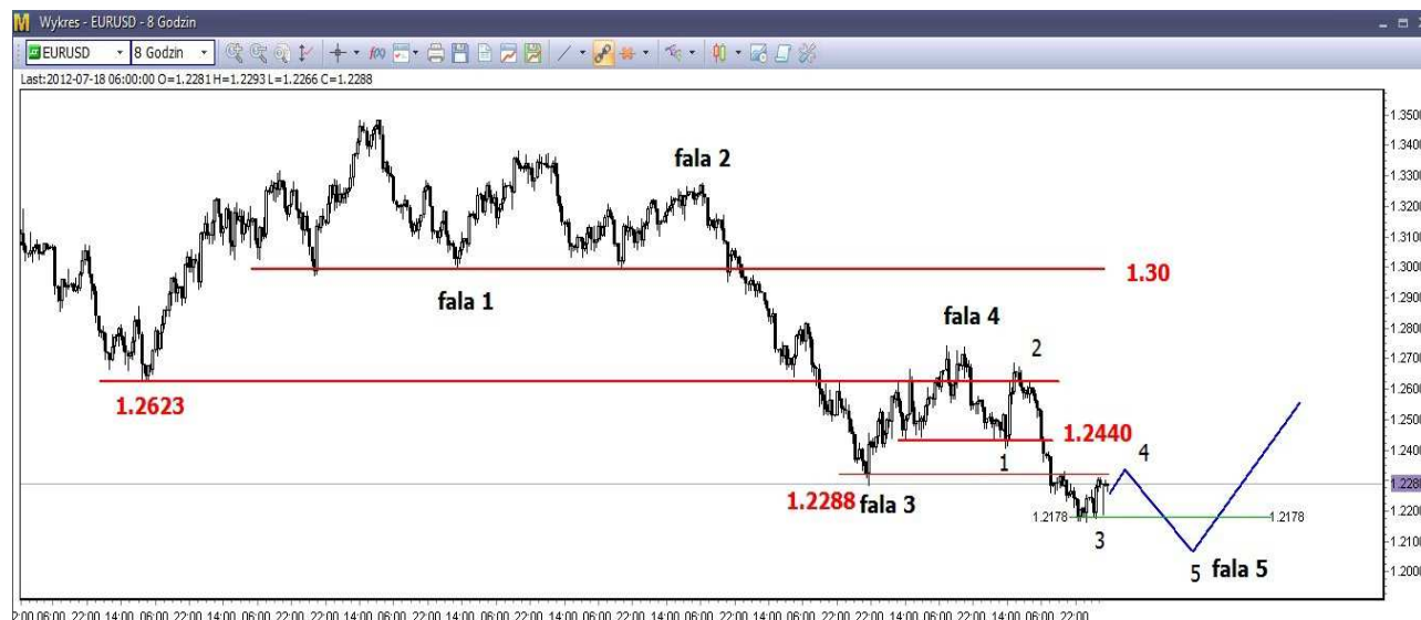
Wykres 2. Eurodolar w perspektywie średnioterminowej

USD/PLN – Z czwartkowego szczytu (3.4548 PLN) rozpoczęły się korekcyjne spadki. W poniedziałek dotarli one do poziomu 3.4035 PLN, we wtorek do 3.3791 PLN, zamknięcie po 3.3828 PLN. Dziś o godzinie 09:20 dolar był notowany po 3.3855 PLN (poprzednio 3.3990 PLN).