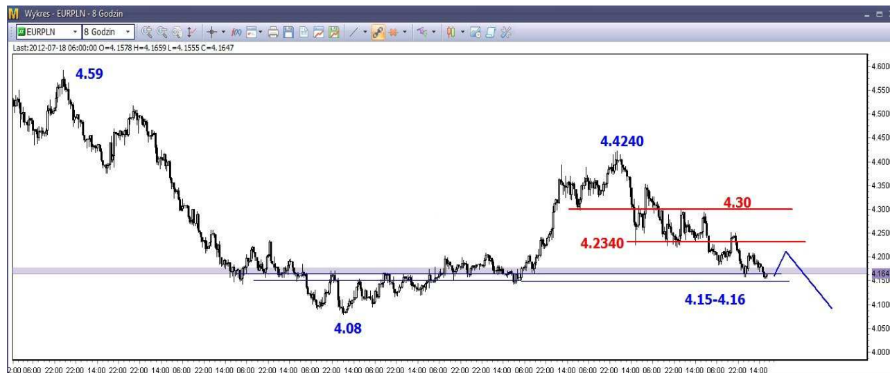
Wykres 4. Euro w relacji do złotego (EUR/PLN)

W krótkim terminie możliwe niewielkie cofnięcie. Wsparcie znajduje się w rejonie 4.15-4.16 PLN. Potem gdy rozpocznie się kolejny ruch w dół na eurodolarze możliwe odbicie (wykres 4). Po jego zakończeniu oczekują spadków i przełamania wsparcia w rejonie 4.15-4.16 PLN, co otworzy drogę do spadków na tegoroczne dno (4.08 PLN).