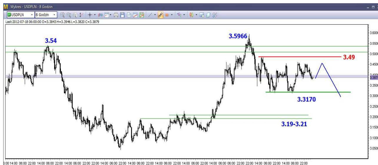
Wykres 3. Dolar amerykański w relacji do złotego (USD/PLN)

W krótkim terminie możliwy jest test wsparcia w rejonie 3.3870-3.4000 PLN. Wsparcie powinno zostać obronione. Późniejsze odbicie może dotrzeć w rejon oporu, które wyznaczają lokalne szczyty sprzed kilku dni (3.4550-3.4650 PLN) oraz silna bariera w okolicy 3.49 PLN (wykres 3). Gdy rozpocznie się trwalsze odbicie na eurodolarze oczekuję na mocniejszy ruch w dół na parze USD/PLN.