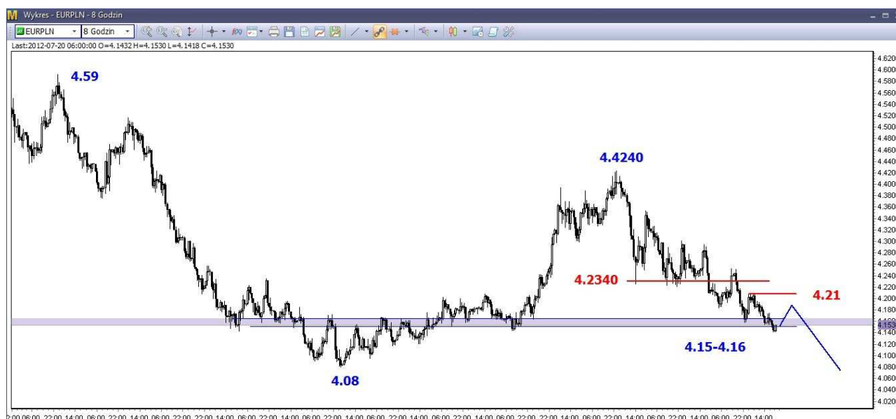
Wykres 4. Euro w relacji do złotego (EUR/PLN)

Silne i ważne wsparcie znajduje się w rejonie 4.15-4.16 PLN. Od kilku dni jest ono testowane. Sądzę, że zostanie obronione i rozpocznie się kilkusecyjne korekcyjne odbicie (wykres 4). Po jego zakończeniu oczekuję spadków i przełamania wsparcia w rejonie 4.15-4.16 PLN, co otworzy drogę do spadków na tegoroczne dno (4.08 PLN).