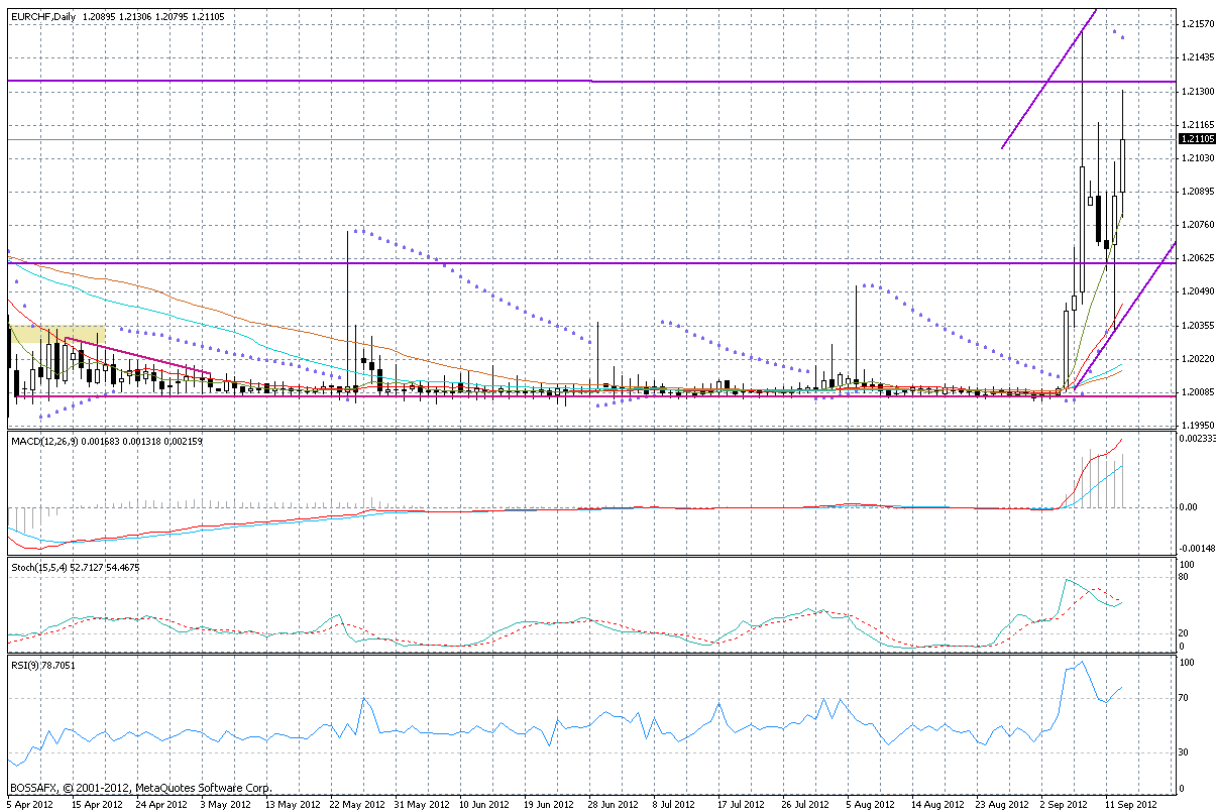
Wykres dzienny EUR/CHF