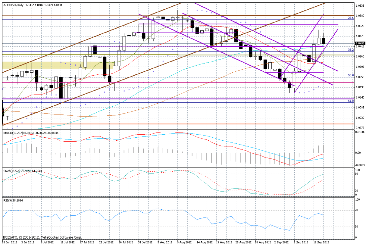
Wykres dzienny AUD/USD

Kluczowe opory: 1,0450; 1,0510; 1,0535; 1,0555; 1,0580; 1,0615