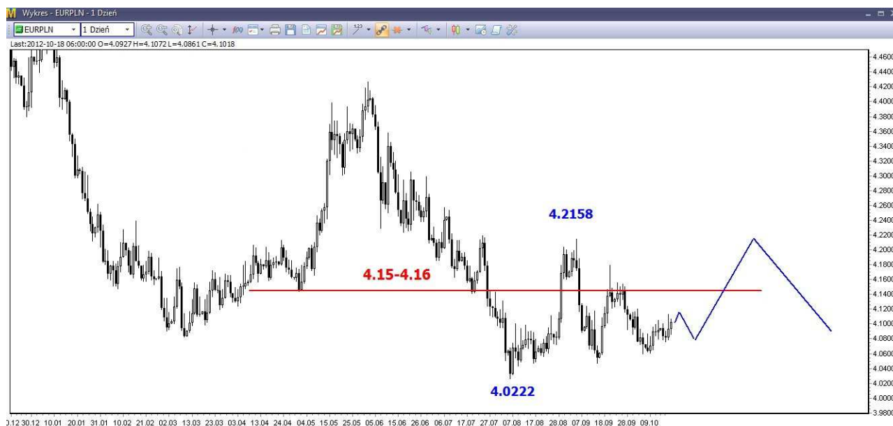
Wykres 4. Euro w relacji do złotego (EUR/PLN)

W perspektywie najbliższych dni oczekuję niewielkich spadków. Wrześniowe minimum (4.0222 PLN) nie powinno być osiągnięte. Wcześniej widoczne jest inne silne wsparcie. Znajduje się ono w rejonie 4.06 PLN. Próba jego trwałego rozbicia (lub osiągnięcia) może się nie udać i w rezultacie możliwe jest mocniejsze odbicie (wykres 4). Silny opór znajduje się w rejonie 4.15-4.16 PLN oraz 4.20-4.22 PLN. W dalszej perspektywie (kilka miesięcy) możliwe spadki i powrót na tegoroczne minimum (4.02 PLN) i niżej.