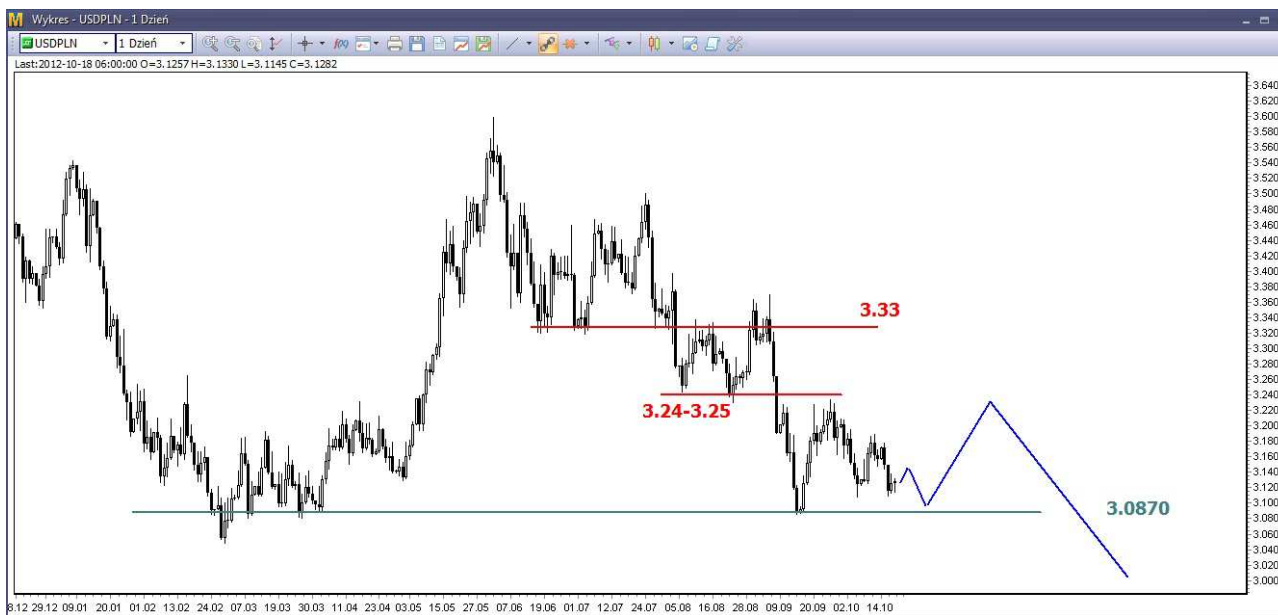
Wykres 3. Dolar amerykański w relacji do złotego (USD/PLN)

USD/PLN – W środę w nocy kurs dolara spadł do poziomu 3.1092 PLN (poprzednio 3.1124 PLN), potem rozpoczęło się odbicie. Dzielne maksimum wypadło na poziomie 3.1390 PLN. Zamknięcie po 3.1196 PLN. Dziś rano kurs dolara rósł. O godzinie 12:05 dolar był notowany po 3.1292 PLN (poprzednio 3.1212 PLN).