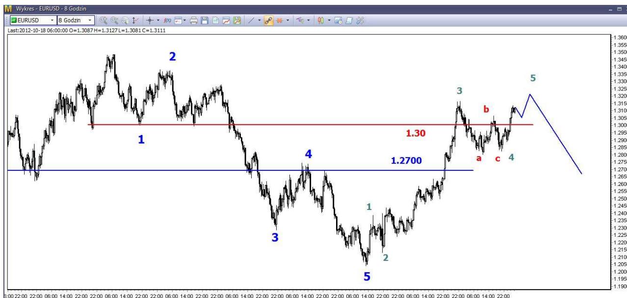
Wykres 2. Eurodolar w perspektywie średnioterminowej

USD/PLN – W środę w nocy kurs dolara spadł do poziomu 3.1092 PLN (poprzednio 3.1124 PLN), potem rozpoczęło się odbicie. Dzielne maksimum wypadło na poziomie 3.1390 PLN. Zamknięcie po 3.1196 PLN. Dziś rano kurs dolara rósł. O godzinie 12:05 dolar był notowany po 3.1292 PLN (poprzednio 3.1212 PLN).