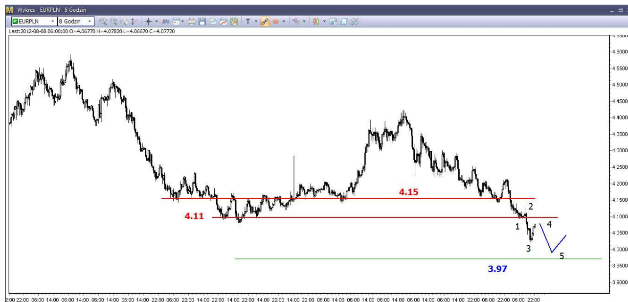
Wykres 4. Euro w relacji do złotego (EUR/PLN)

Odbicie z poniedziałkowego dna (4.0222 PLN) ma dosyć duży zasięg, jednak powinno być korekcyjne i może się dziś zakończyć. Potem oczekuję pogłębienia dna na poziomie 4.0222 PLN. W efekcie pojawi się 5-falowa struktura (wykres 4) i możliwe będzie dłuższe odbicie, po wcześniejszym osiągnięciu długoterminowego wsparcia w rejonie 3.97-4.00 PLN. Bardzo silna średnioterminowa bariera znajduje się w rejonie 4.11 PLN.