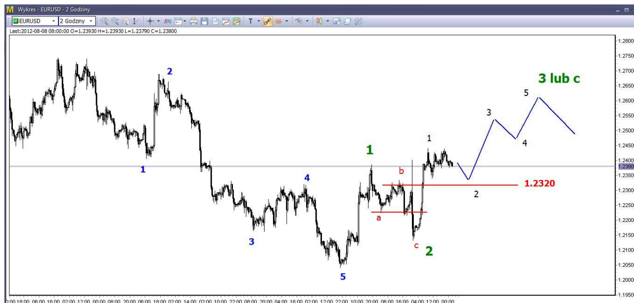
Wykres 1. Eurodolar w perspektywie krótkoterminowej

Przełamanie oporu w rejonie 1.2320 doprowadziło do pojawienia się sygnału do korekty spadków z tegorocznego szczytu (1.35 USD). Taka korekta może potrwać kilka tygodni i doprowadzić do wzrostów nawet w rejon 1.26 USD. Tam znajduje się kluczowy opór w postaci styczniowego dna (1.2623 USD). Odbicie z lipcowego dna (1.2041 USD) powinno przyjąć postać co najmniej dużej trójki (a-b-c). Jeśli się na