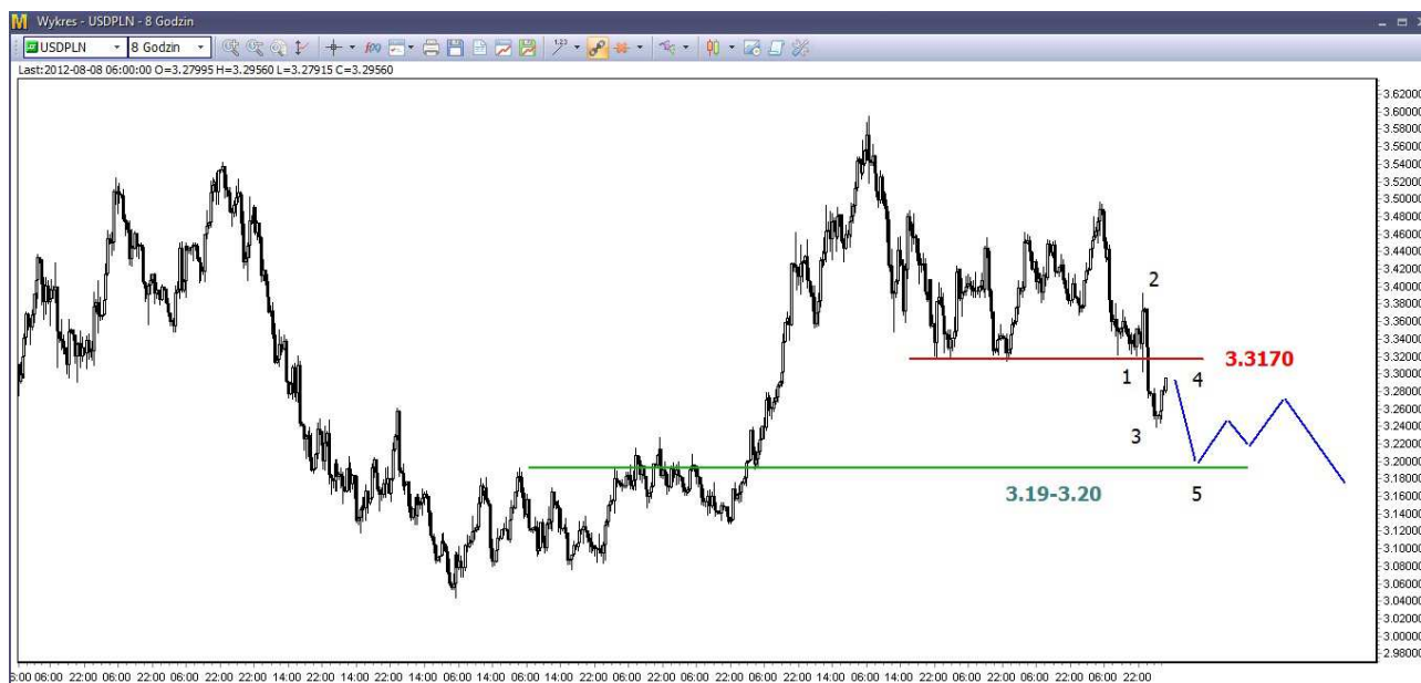
Wykres 3. Dolar amerykański w relacji do złotego (USD/PLN)

USD/PLN – We wtorek doszło do odbicia. Dzielne maksimum wypadło na poziomie 3.2829 PLN, zamknięcie po 3.2782 PLN. Dziś o godzinie 08:25 dolar był notowany po 3.2775 PLN (poprzednio po 3.2560 PLN).